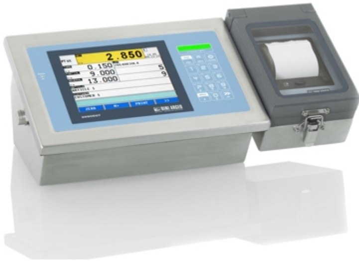
3590egt mit Edelstahl IP65 Drucker